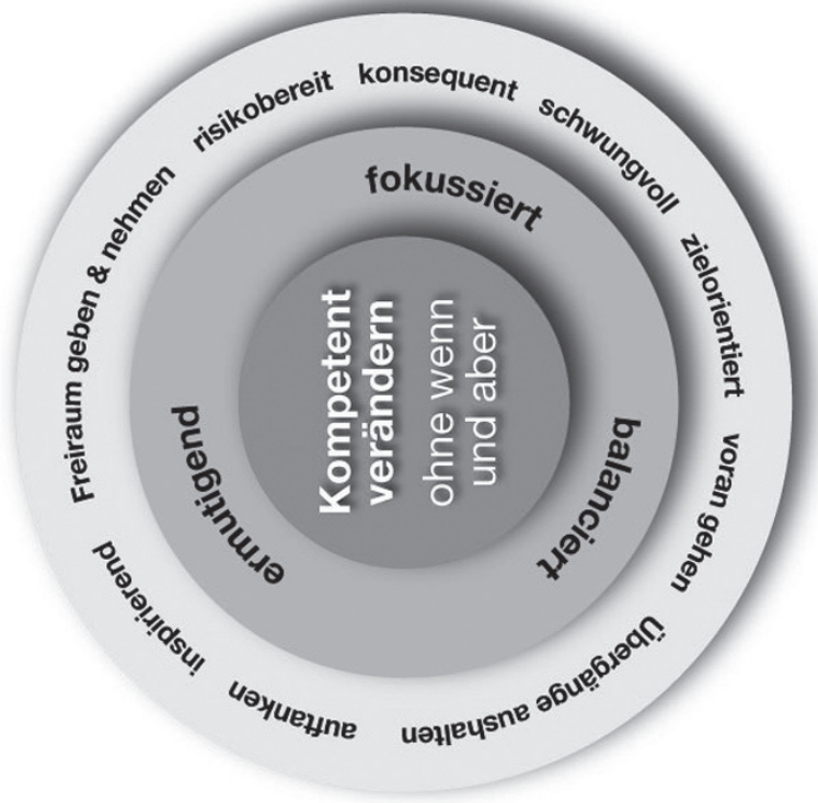
Abbildung 3: Veränderungskompass©