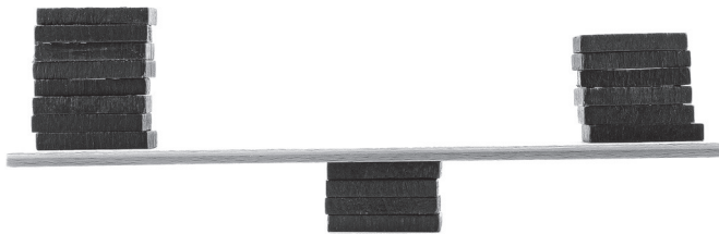
Abbildung 1:

Schwierig und herausfordernd sind Veränderungen insbesondere für Führungskräfte in der Sandwichposition, wenn sie einerseits nicht verstehen und akzeptieren können, was die Geschäftsleitung verändern will. Andererseits müssen sie diese Vorhaben überzeugend bei ihren eigenen Mitarbeitern auf eine Weise vertreten, dass diese motiviert sind und mitziehen. Möglicherweise ist die Führungskraft selbst in der Situation emotional gefordert, da sie noch gar nicht weiß, ob ihr eigener Arbeitsplatz noch sicher ist.